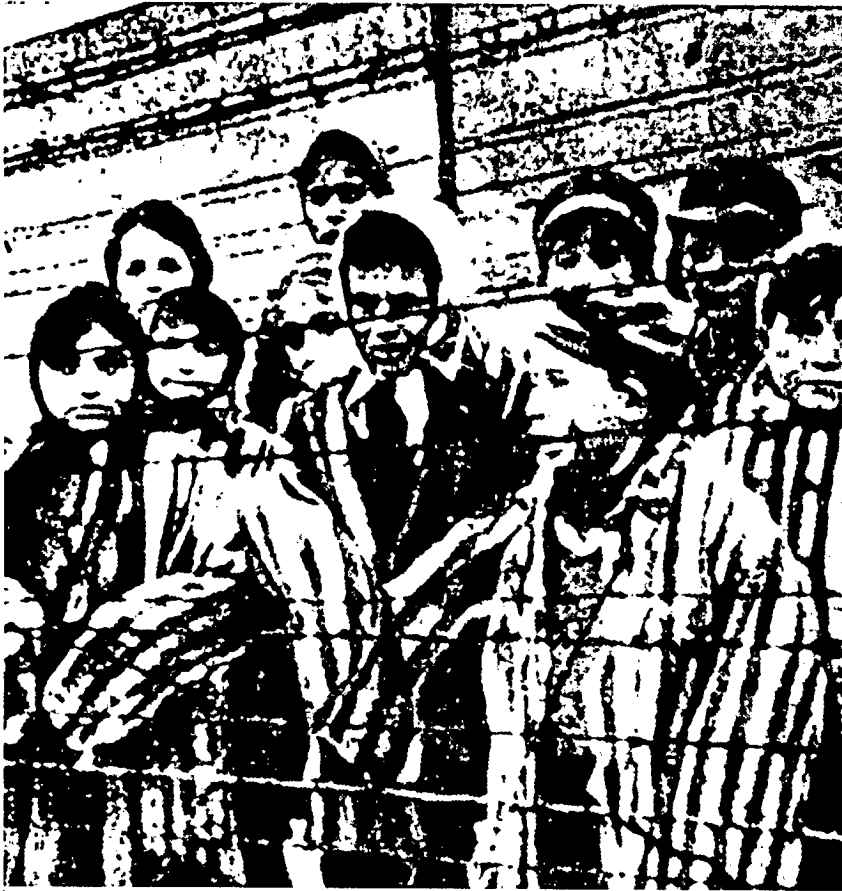
"...המימד הבלתי מובן של היתר זה הניתן לרע"

הראשונה – דרך הזכות – והם מתארים את קץ הגלות ככבוד ובתפארת, ובאמצעות נסים גלויים. מאידך, מאמרים המתייחסים לגאולה בבחינת "בעתה", ובהם צרורה דאגה עמוקה.