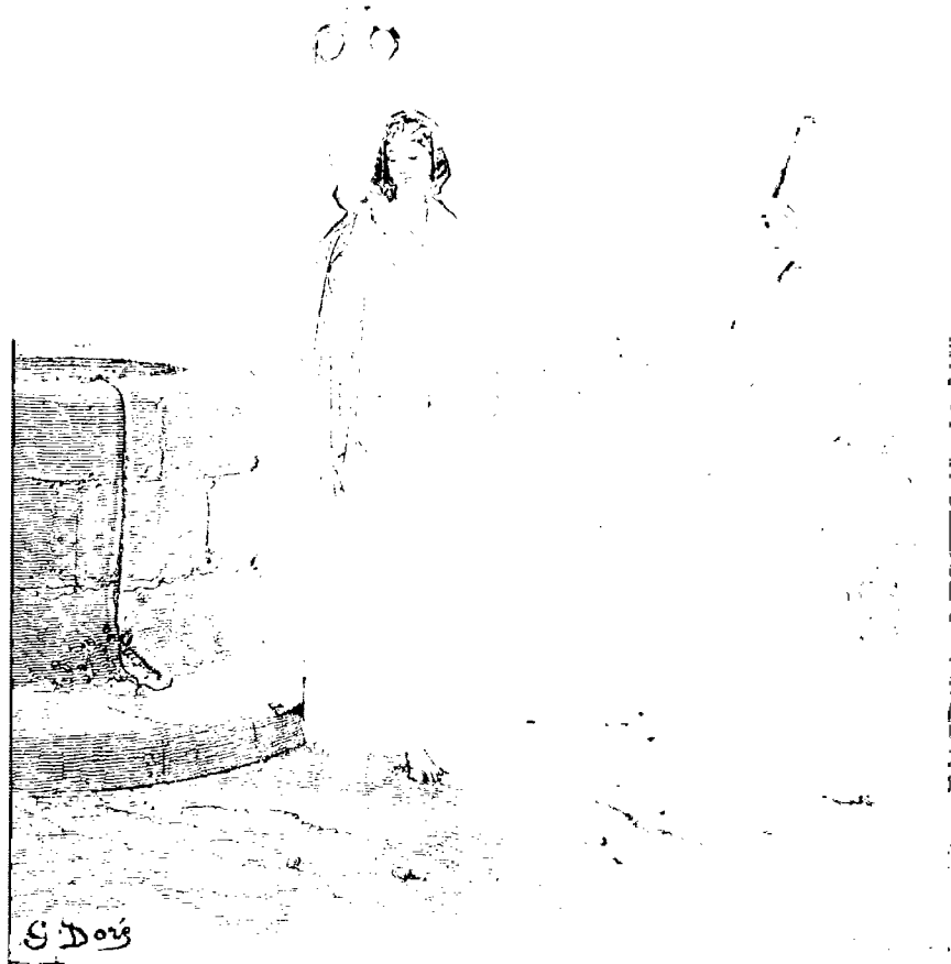
"יואחר עד עתה" (יעקב רועה את צאן לבן צייר גוסטב דורה)

לא ראינו עד כה שיתוף פעולה מעין זה, אך הוא הכרחי כדי להשיב לעמנו את הכוח הדרוש לו למלא את ייעודו. ●