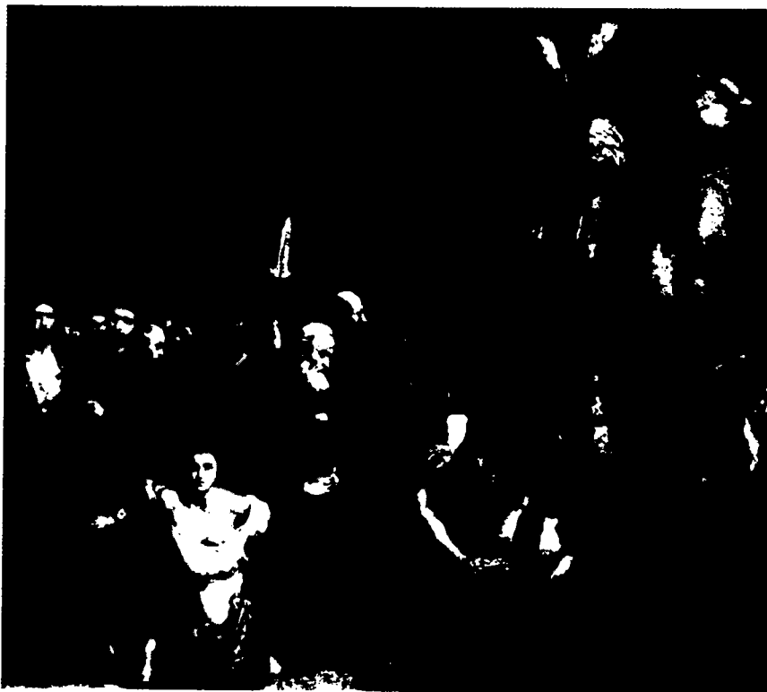
"האינקוויזיציה: אי-אפשר להתחמק מן השאלה באמצעות באנאליזציה..."

* במישור אחר לגמרי, אך השייך לעניינינו באופן מהותי, כדאי לזכור כיצד צמחה הנצרות, בימי החורבן, כדת ממקור יהודי מנותק מהזהות הלאומית היהודית. יש מקום לאפשרות דומה במישור התרבותי.