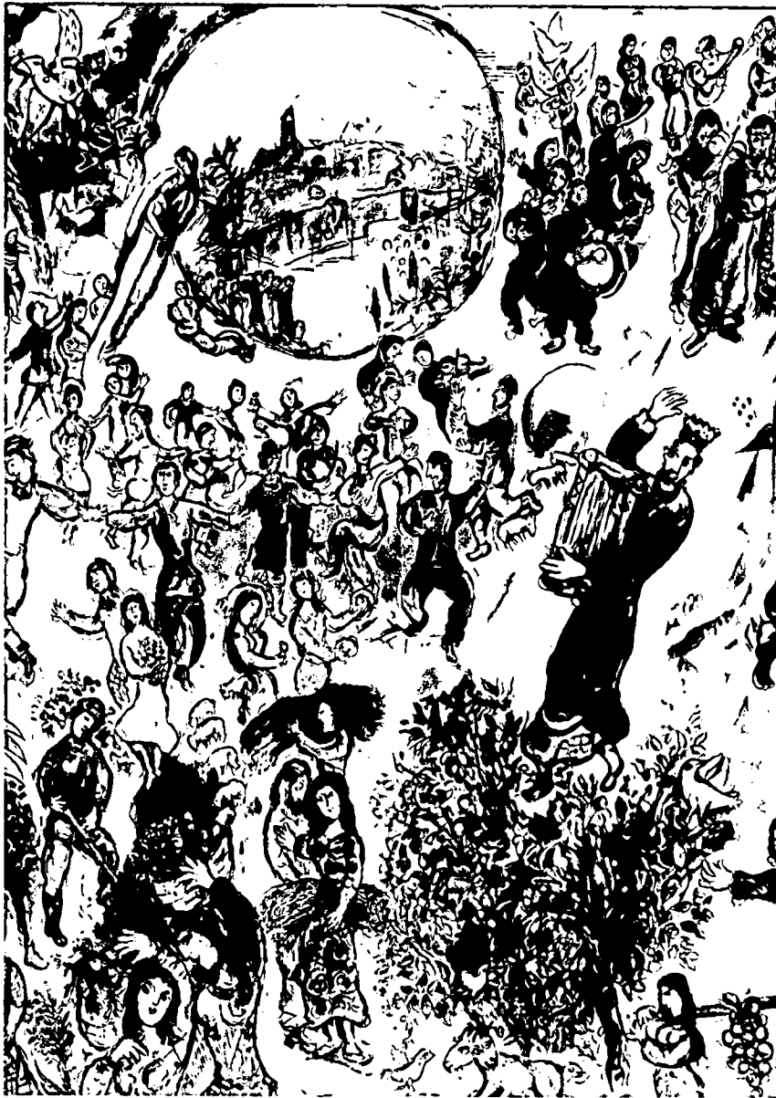
"ישובו בנים לגבולם" (ההכניסה לירושלים) - ציור מרק שאגאל

שלישית, אין ספק שהאומות הפרו את התחייבותן "שלא ישתעבדו בהן בישראל יותר מדי" - וזאת עוד בימי הרדיפות הנוראות במזרח אירופה ובמרכזה, זמן רב לפני שהופיע הנאציזם.