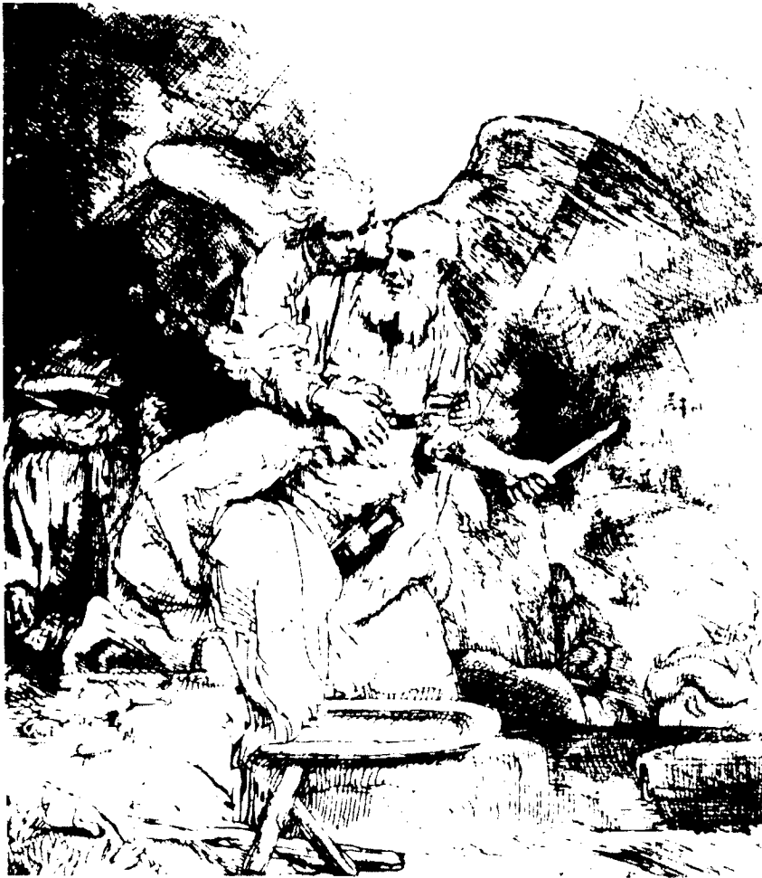
"...ואל תעש לו מאומה... לא הוקרב הכרוב והנעקד מרצונו נעקד צייר רמברנט ון ריז'ן מוויאני ישראל

הטוב, יוכל, כאשר יפרו ערכים אלה, לשאת בתוצאותיה של הפרה זו. הילכך, אין שום חשיבות לפרטי המאורע, לדרך הקרבת הקרבן. רק עצם הקרבן הינו בעל משמעות. במילים אחרות, אם יש צורך בסבל, הדרך בה סובלים הינה משנית. מכל מקום, ברור שניייה זו, בקרב היהודים, לתת הסבר לשואה בקטגוריות של "עקידת יצחק", אינה אלא נטייה מתנצרת.